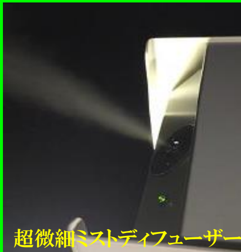
超微細ミストディフューザー