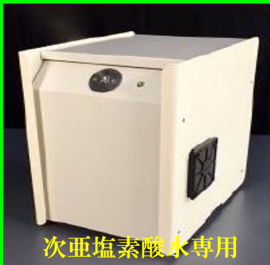
次亜塩素酸水専用